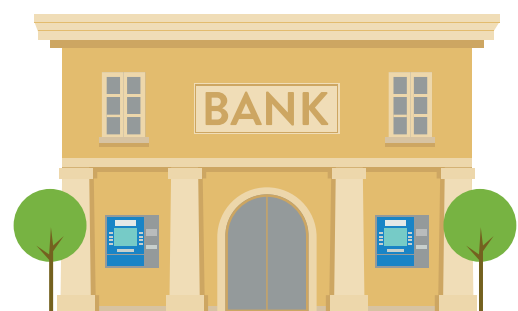
Banc y stryd fawr