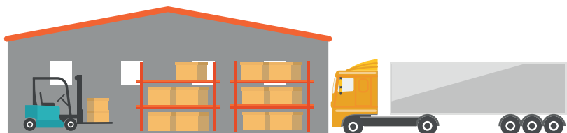
Busnes sy'n gwerthu i fusnesau (Cynhyrchwyr/Cyflenwyr/Gweithgynhyrchwyr)