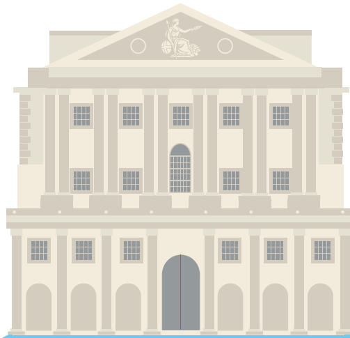
Bank of England